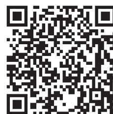
申込フォーム QRコード

豊橋技術科学大学 先端農業・バイオリサーチセンター TEL:0532-44-6655 E-mail:info@recab.tut.ac.jp WEBサイト:http://www.recab.tut.ac.jp